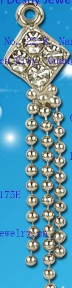
Branco 9999 Sterling Silver Rose Pulseira Padrão Fornecedor China