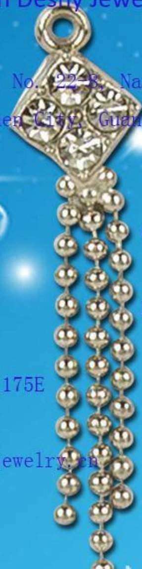
Branco 9999 Sterling Silver Rose Pulseira Padrão Fornecedor China